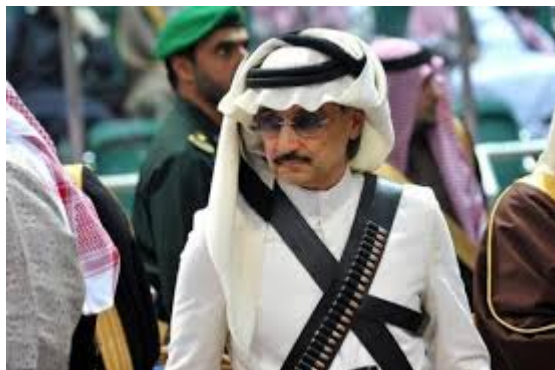
Le Prince :

En 2013, sa fortune est évaluée par Bloomberg à 26 milliards de dollars, au 20 e rang mondial, c'est donc un homme d'affaires important qui ,par la Kingdom Holding Company , détient des parts dans de nombreuses multinationales :