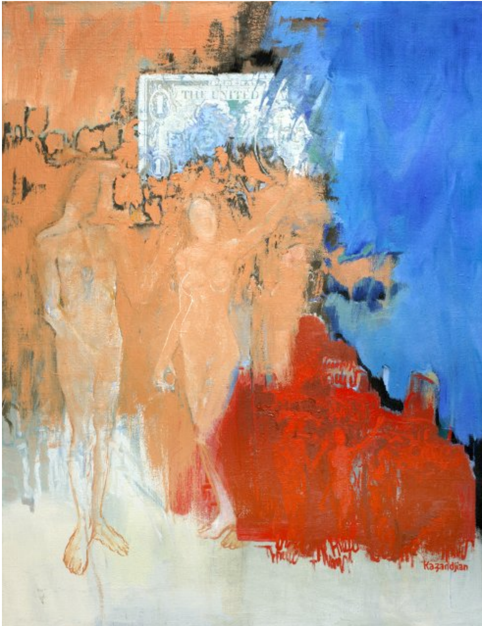
The Temptation after Hugo Van der Goes, 1995