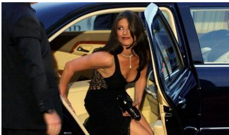
Catherine Zeta-Jones sortant de son véhicule

Le récent MipCom de Cannes a dessiné les grandes tendances de la télévision à travers le monde avec comme tête d'affiche ou stars de stars l'actrice Catherine Zeta-Jones... Ces grandes tendances convergent clairement vers les réseaux sociaux et plateformes sur Internet.