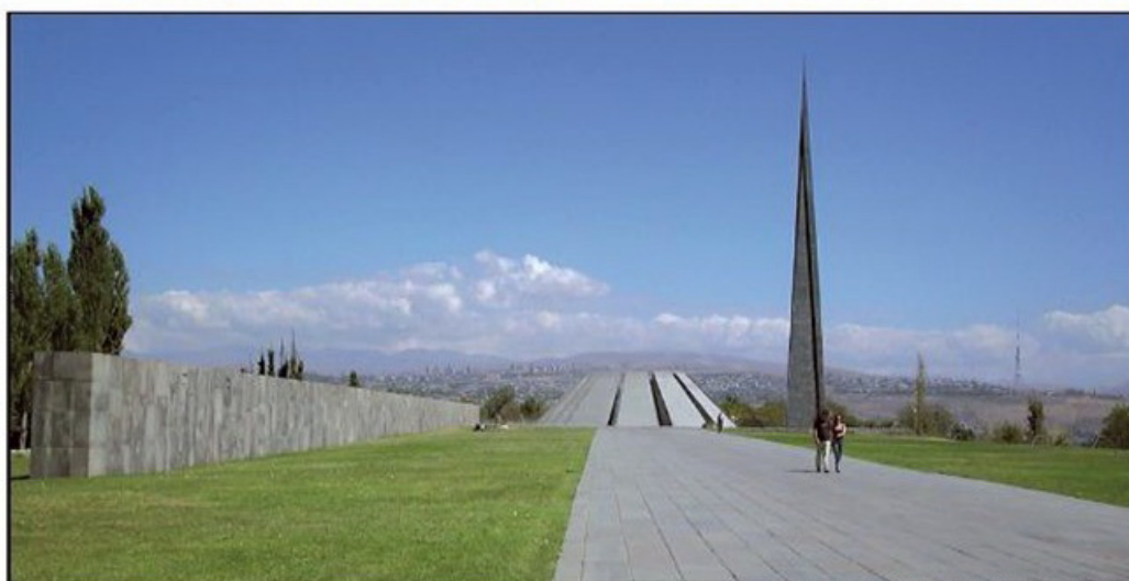
Arménie - Erevan - Monument aux Victimes du génocide