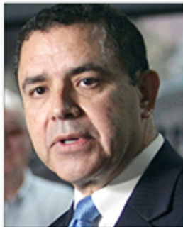
ԱՄՆ Ներկայացուցչական Սանդեմի Գոնկրեսական Զեմարի Քուէլար

Գոնկրեսականին եւ անոր կողմէ մեղադրանք առաջադրուած է մօտ 600 հազար տուրք կաշառք ստանալու դիմաց զատարանի վրայ, տարբերութեան գործընթացի գերին մէջ պետական պաշտոններու արգելքը