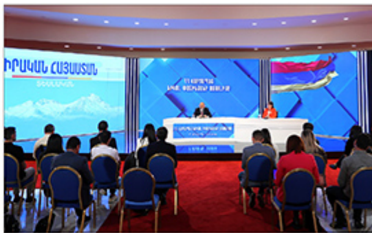
Վարչապետ Նիկոլ Փաշինեան մամուլի ասուլիսի ընթացքին

Անոր արդարեւ ըստ «Տաւուշը լաւուր հայրենիքի» շարժման անդամներուն կողմէ յայտնի քաջազոյ