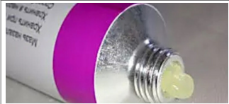
This "Wrinkle-Filling Wonder" Has Walmart Shoppers Obsessed