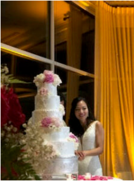
elle va couper le gâteau