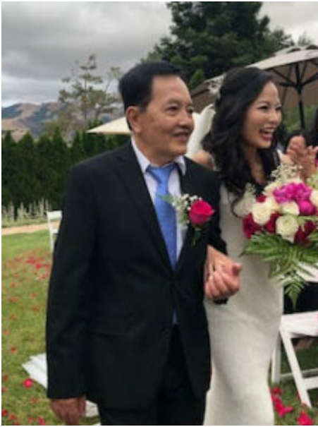
la mariée & son papa