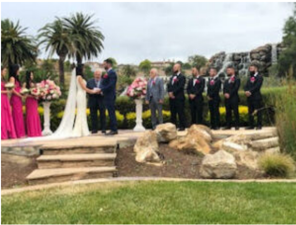
"des gens d'honneur" : les garçons et les filles d'honneur.