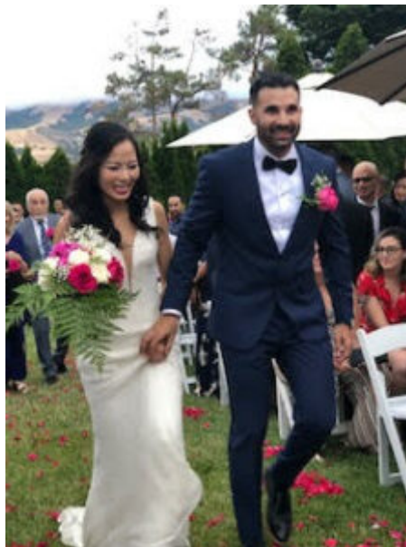
ils vont dire