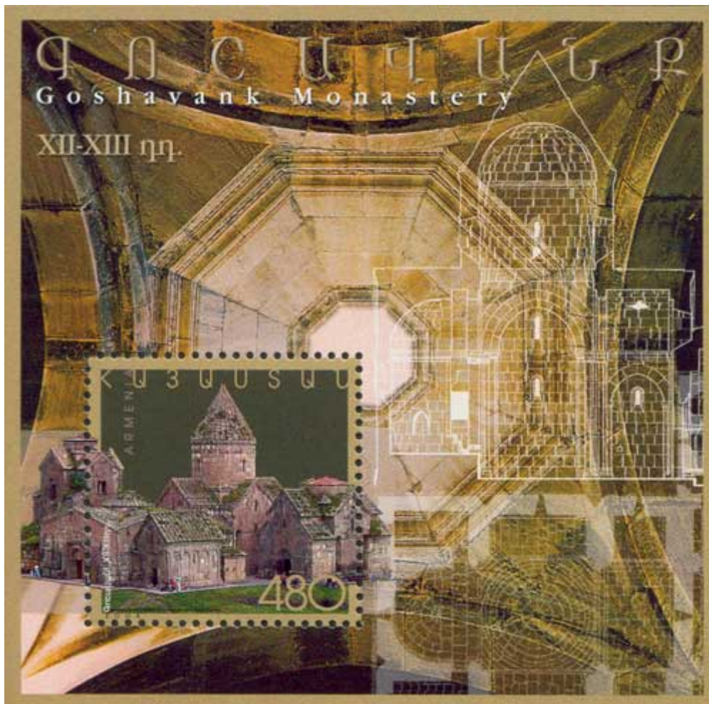
▪ 480 drams, Monastère de Goshavank. Bloc-timbre 21 (512).