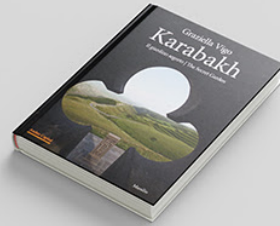
Karabakh: Il giardino segreto / The Secret Garden BUY >