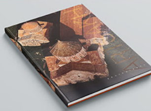
Artsakh Photographs BUY >