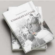
Unmailed Letters BUY >