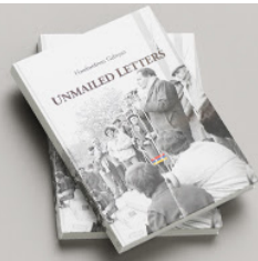
Unmailed Letters BUY >