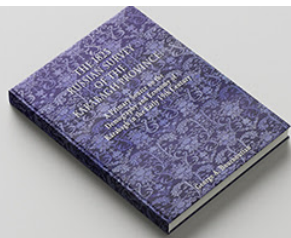
The 1823 Russian Survey of the Karabagh Province BUY >