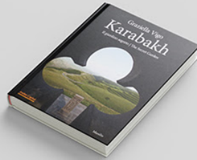
Karabakh: Il giardino segreto / The Secret Garden BUY >